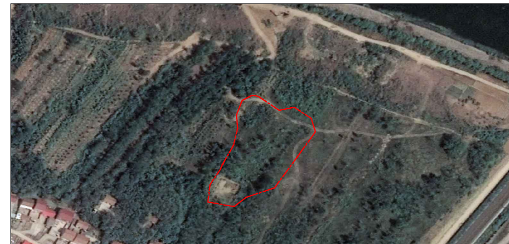
取(弃)土区建设前遥感影像图（2021.8）