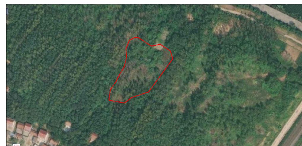
取(弃)土区建设后遥感影像图（2023.8）