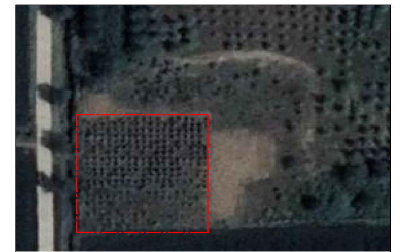
取(弃)土区建设后遥感影像图（2023.8）