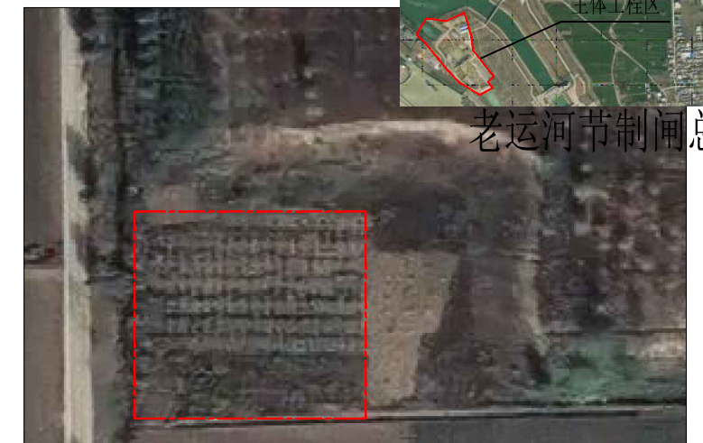
取(弃)土区建设前遥感影像图（2021.8）