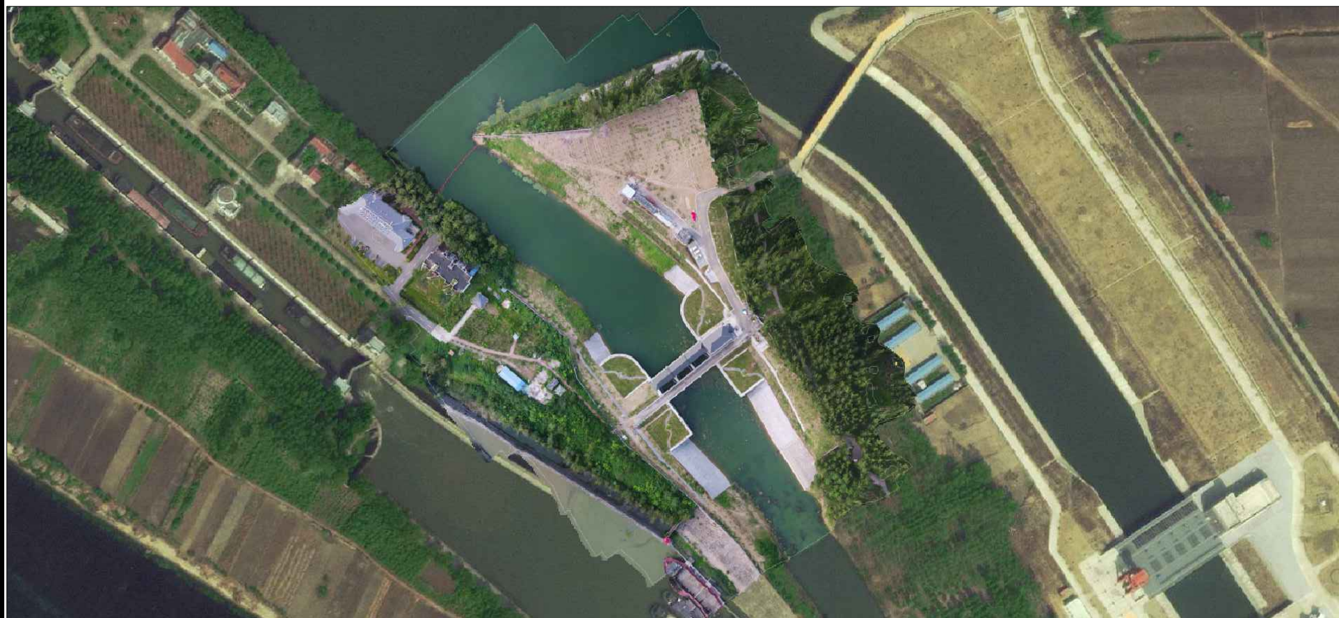
主体工程区建设后遥感影像图（2023.8）