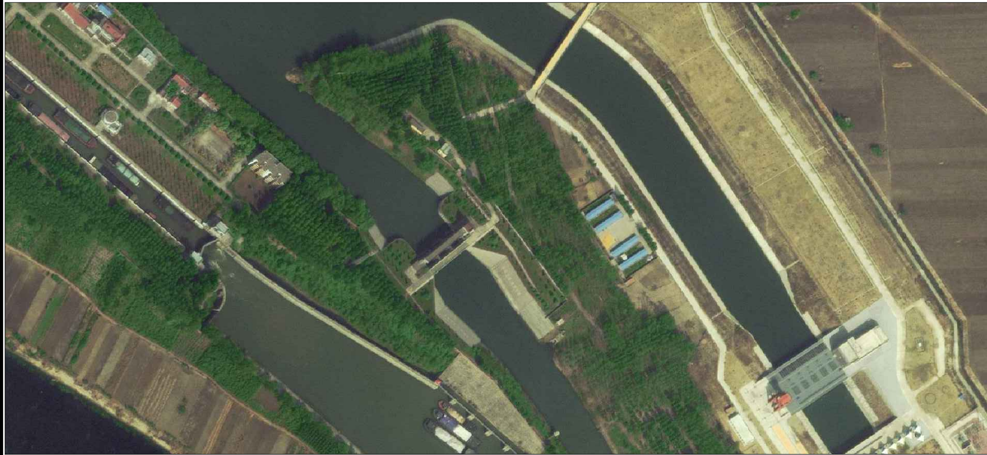
主体工程区建设前遥感影像图（2021.8）